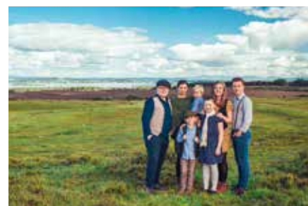
Reise „Irish Summer“ mit Angelo Kelly & Family