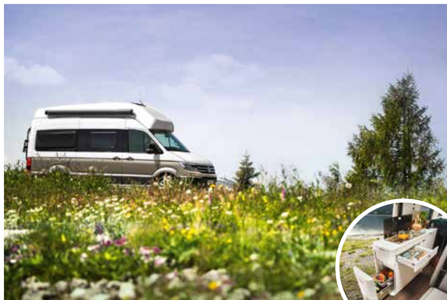
Der Volkswagen Grand California ist ab sofort bei Neuseenland Wohnmobile in der Vermietung.

Vom 6. bis 8. Mai 2022 wird nach zwei Jahren Pause endlich wieder gefeiert und wir sind mit dabei. Wir präsentieren unsere Neuseenland Wohnmobile, eine tolle Cash-Back-Aktion für Volkswagen-Zubehör u.v.m. Also besuchen Sie uns auf dem Markkleeberger Stadtfest.