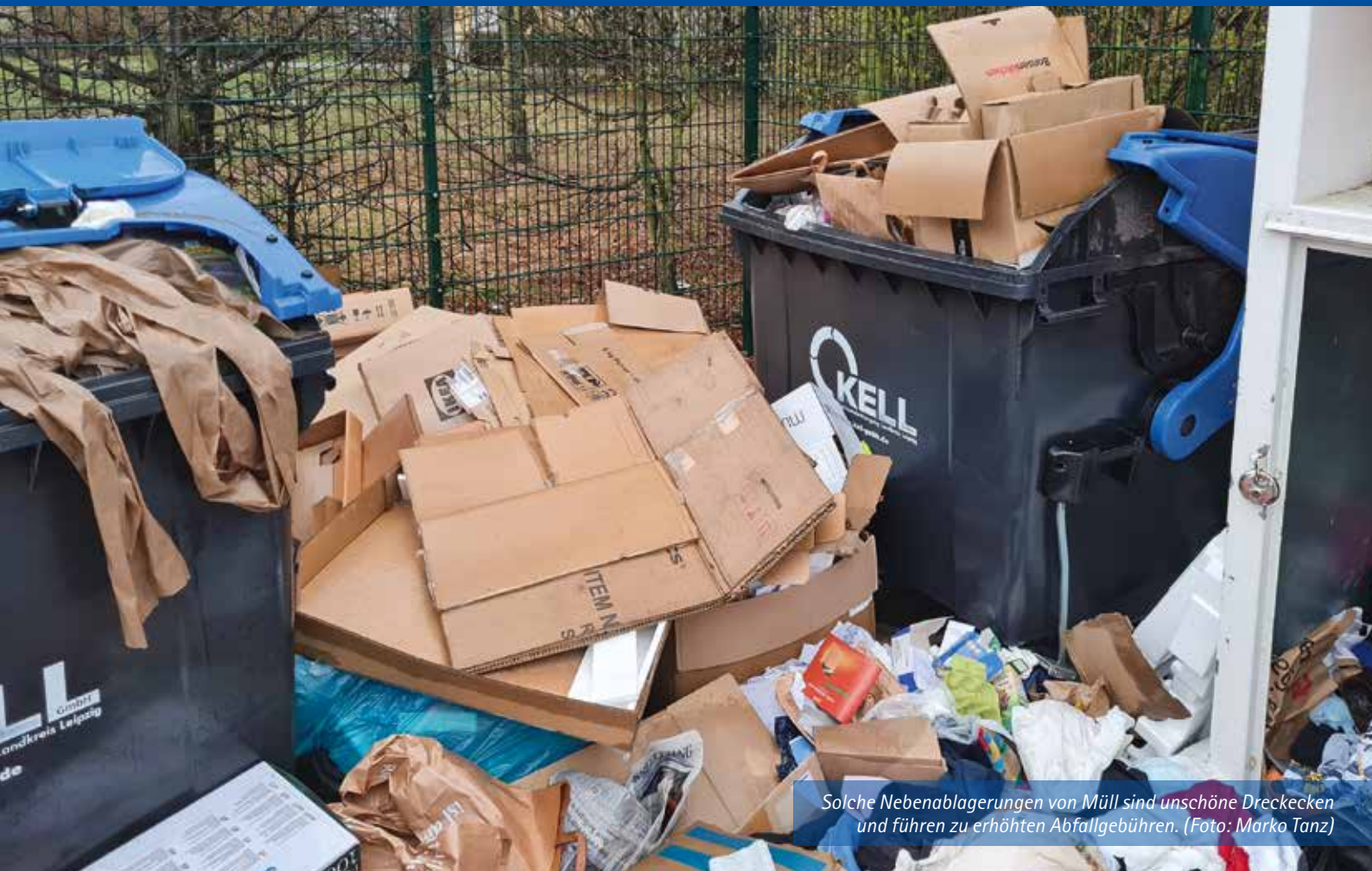
Solche Nebenablagerungen von Müll sind unschöne Dreckecken und führen zu erhöhten Abfallgebühren.

Amts- und Mitteilungsblatt der Großen Kreisstadt Markkleeberg