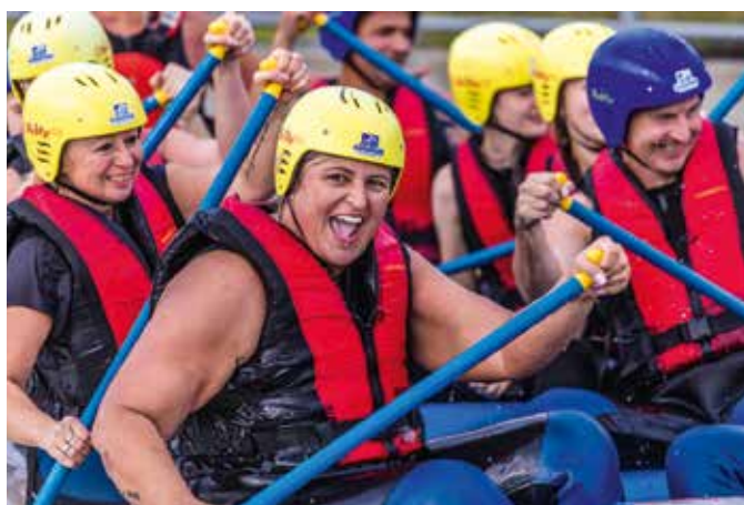
„Happy Rafting-Days“: Im Mai wird das Wildwasser-Erlebnis vergünstigt angeboten