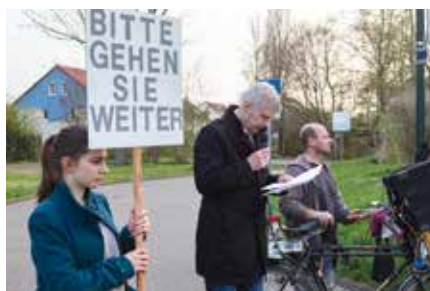
Markkleeberg aktuell Schneublumen-Gedenkweg am 13. April