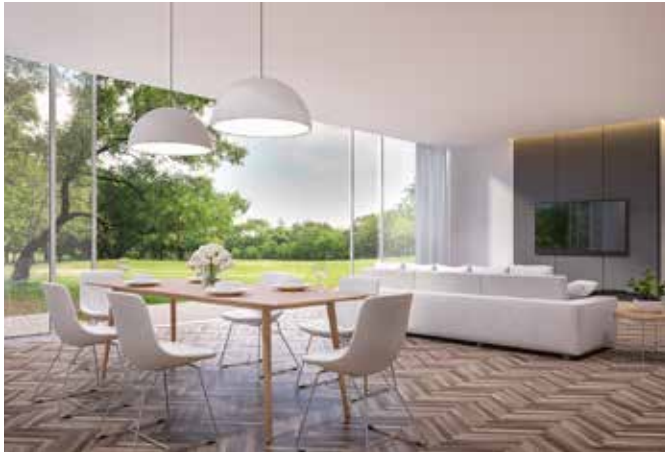
Bodentiefe Glasflächen liegen im Trend. Sie schaffen einen fließenden Übergang zur Außenwelt, erhöhen den Komfort und bringen viel Licht ins Innere.

Bodentiefe Fenster sehen nicht nur toll aus, sie geben auch den Blick in die Außenwelt, wie zum Beispiel den Garten, frei. Zusätzlich bringen sie viel Tageslicht ins Innere. Das lässt den Raum heller und freundlicher erscheinen. Wer sich für große Glasfronten entscheidet, kann zwischen Fensterwänden mit Festverglasung und Hebeschiebetüren wählen. Beim Einbau sollten nur auf Wohngesundheit geprüfte und sehr emissionsarme Materialien zum Einsatz kommen. Man erkennt sie am Emissioncode-Siegel.